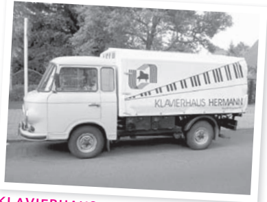
KLAVIERHAUS MOBIL Unser »Soli-Beitrag zur musikalischen Wiedervereinigung« fährt jetzt in Berlin.