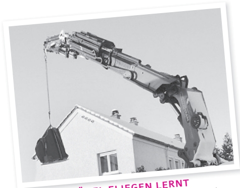
WIE DER FLÜGEL FLIEGEN LERNT Für den perfekten und sicheren Transport ist dem Klavierhaus kein Aufwand zu groß.